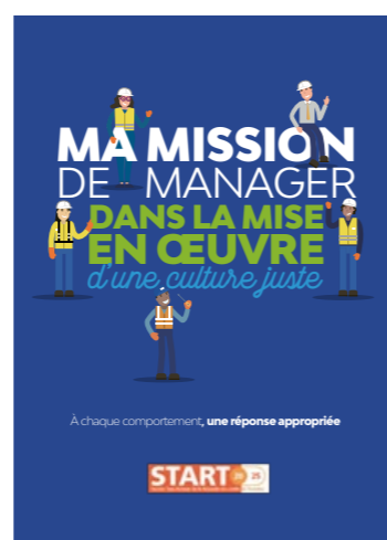
UN DOCUMENTO PARA EDF

La presencia en el terreno es uno de los principios clave del liderazgo en seguridad; es una herramienta fundamental para medir el grado real de implementación de la seguridad y demostrar la implicación concreta de la gestión. En particular, las visitas de seguridad ofrecen una oportunidad ideal para establecer contacto con los equipos, para observar y dialogar. A petición de sus miembros, el Icsi desarrolló en 2022 un kit de despliegue presencial y a distancia. Este dispositivo se ha implementado con éxito en BASF, Engie y GRDF.