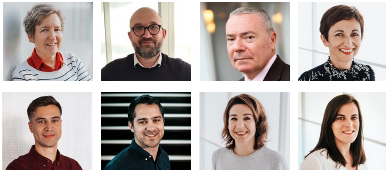
La mayor parte del equipo del Icsi a principios de 2023

El Icsi es una asociación a escala humana cuya fuerza reside en el compromiso y el dinamismo de su equipo, integrado por alrededor de treinta empleados. El Instituto también cuenta con el apoyo de una red de voluntarios y aliados comprometidos con sus objetivos.